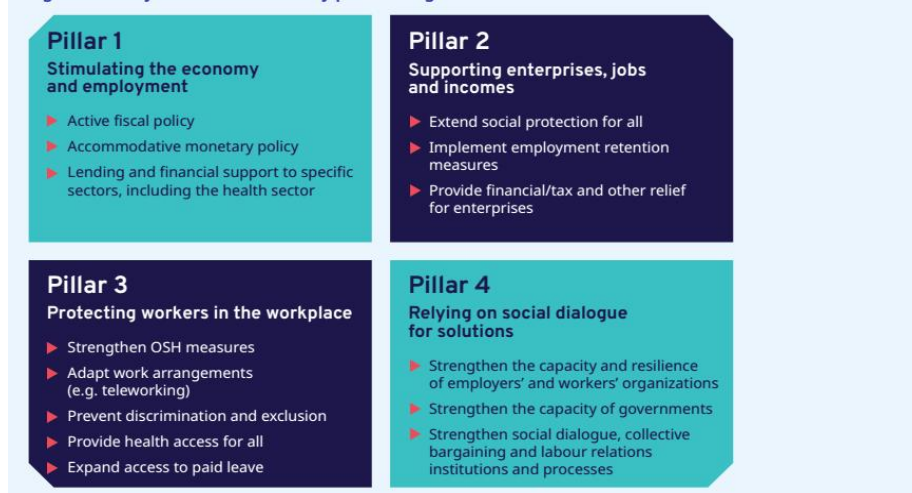
► Figure 4. Policy framework: Four key pillars to fight COVID-19 based on International Labour Standards