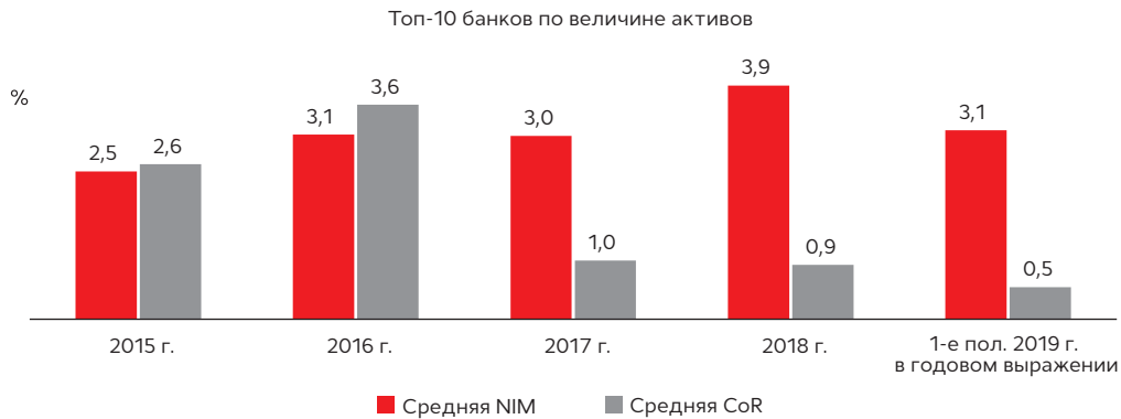
График 7. В 1-м полугодии 2019 года у 10 крупнейших банков заметно сократился уровень чистой процентной маржи