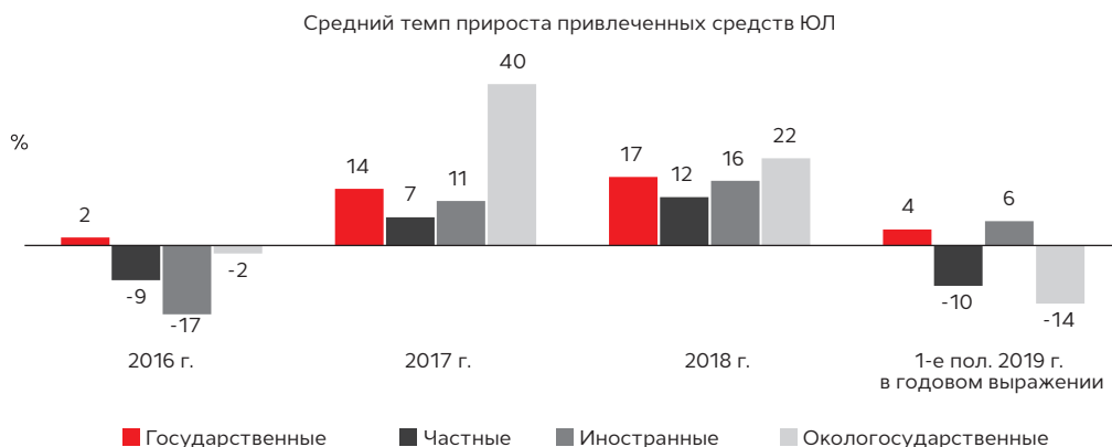
График 3. В 1-м полугодии 2019 года наиболее заметные оттоки привлеченных средств ЮЛ наблюдаются у частных и окологосударственных банков