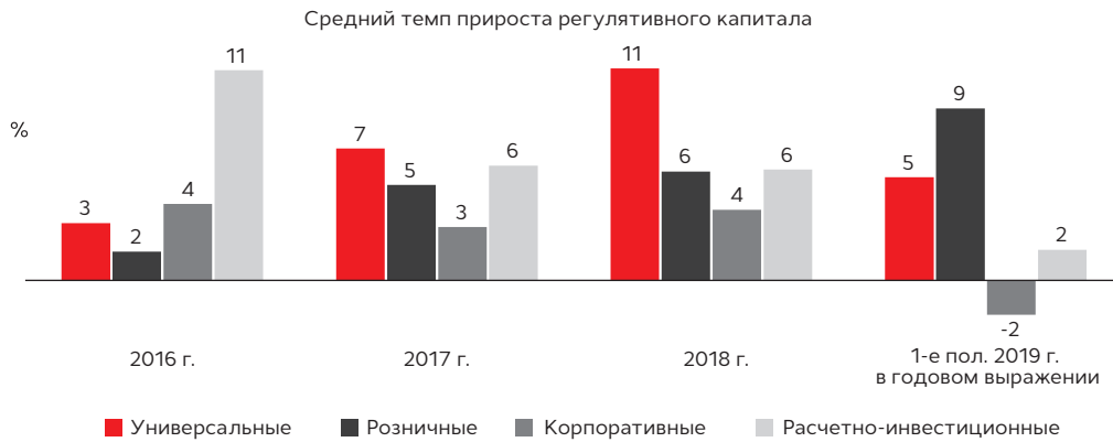
График 8. У всех групп банков, кроме розничных, регулятивный капитал** демонстрировал слабый рост либо снижение

** Собственные средства по данным формы 0409123.