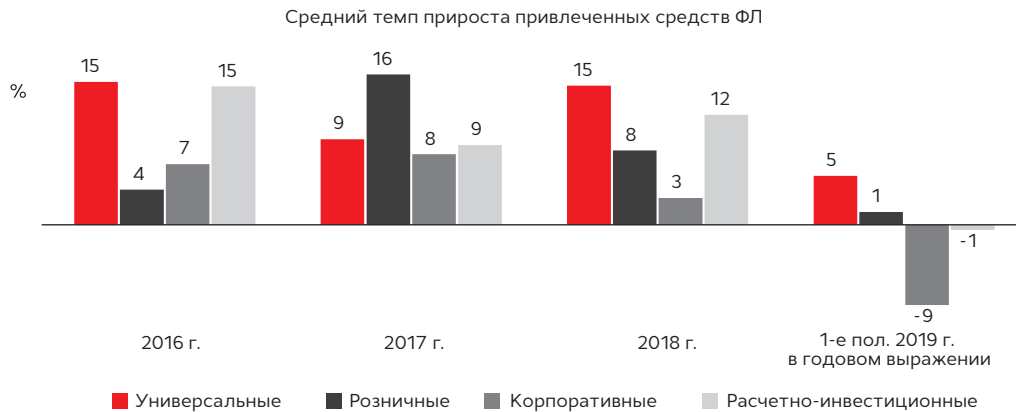
График 4. По итогам 1-го полугодия 2019 года у всех типов банков наблюдается снижение темпов роста средств ФЛ