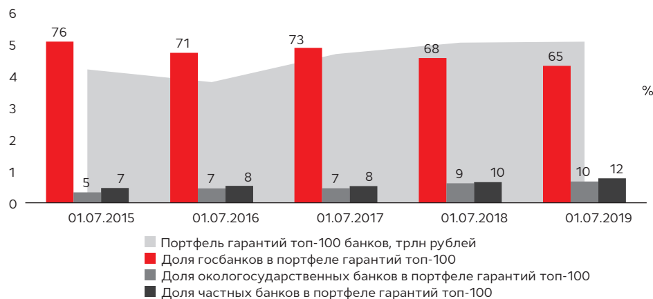
График 6. В последние два года доля частных банков на рынке гарантий увеличивается