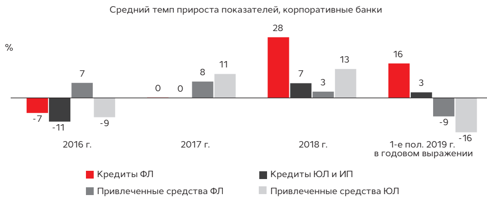
График 5. По итогам 1-го полугодия 2019 года у корпоративных банков отмечается стагнация бизнеса