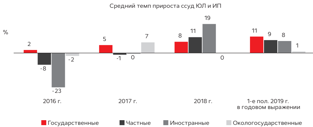
График 1. В 1-м полугодии 2019 года госбанки показали наибольшие темпы роста* корпоративного кредитования

* Здесь и далее темп прироста показателей по группам банков рассчитан как медианное значение темпов прироста каждого из банков группы.