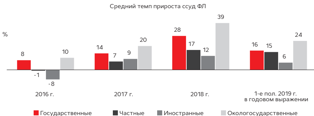
График 2. В 1-м полугодии 2019 года темпы роста розничного кредитования замедлились у всех групп банков