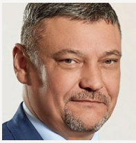
Евгений Никитин Генеральный директор, РУСАЛ