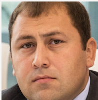
Мурад Керимов Заместитель Министра природных ресурсов и экологии Российской Федерации